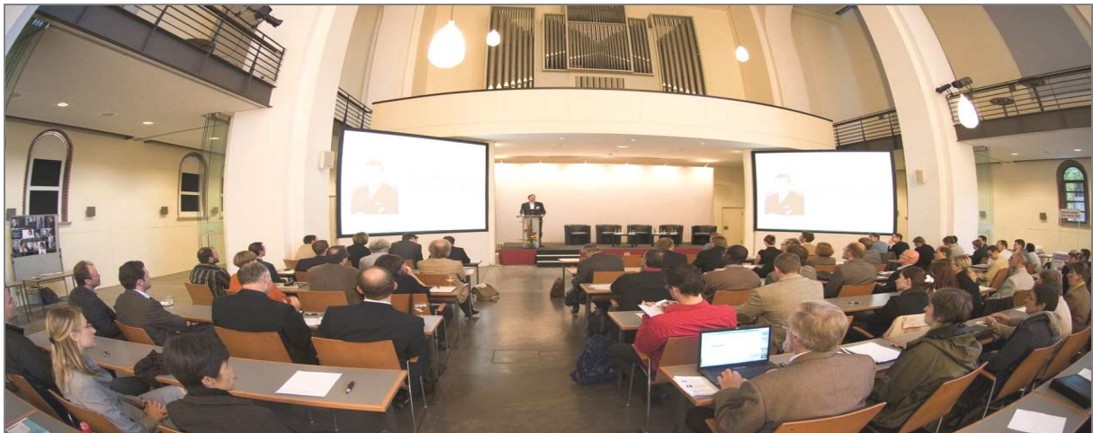
FührungskräfteTag 2009 im Berliner Umweltforum

Das Verhältnis von Christen zu Noch-nicht-Christen war erstmals etwa 50/50. Von einer Firma hat der gesamte Führungsstab, 12 Personen, teilgenommen. Die Chefin hat mich später zu einer internen Führungsklausur als Gastsprecher eingeladen. Das ist ein Schritt in eine neue Rolle für YPLL und bietet Kontakte zu Führungskräften, die Gott noch nicht kennen.